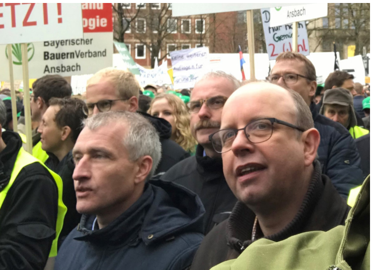
>>> ZENTRALE DEMONSTRATION DER LANDWIRTE IN MÜNSTER: Auch unsere Landwirte waren bei der Bauerndemo. Wir teilen die Sorgen um den Erhalt landwirtschaftlicher Betriebe in unserer Region und in ganz Deutschland.

Dinkelpost: Das hört sich sehr spannend an. Neben dem Jubiläum beschäftigen euch